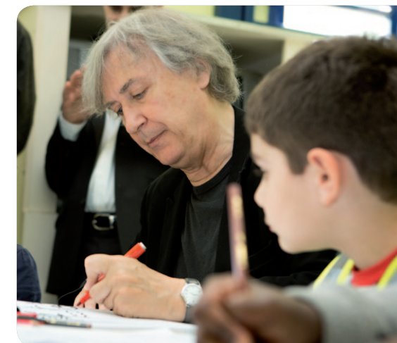
Rencontre avec Plantu lors d'un atelier avec Cartooning for Peace Juin 2015